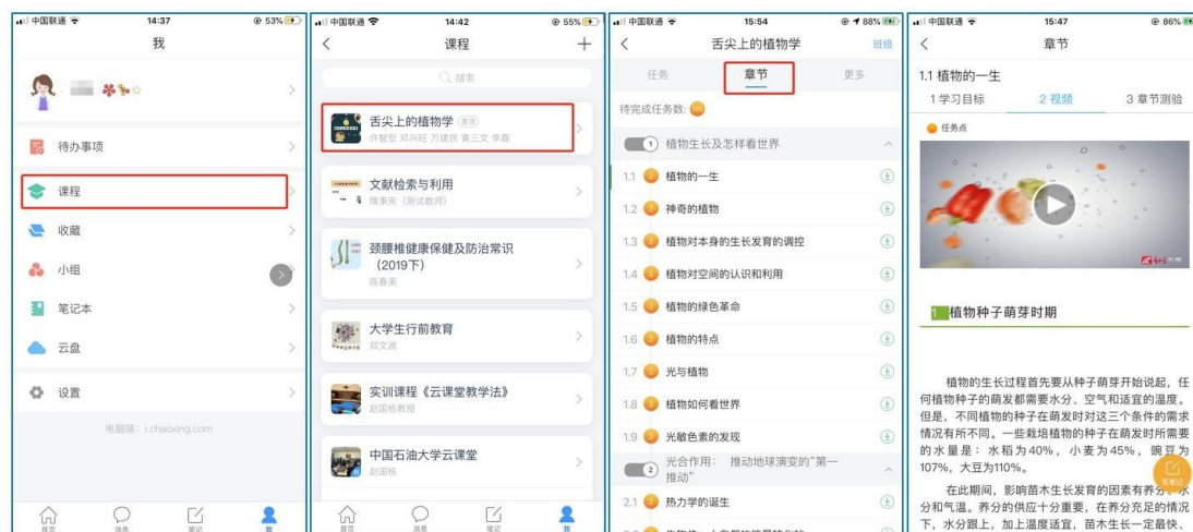
图 7 移动端课程学习

点击底部菜单“我”—“课程”，可进入课程列表，再选择要学习的课程，即可进入课程详情，章节内容即为学习内容，在章节学习过程中可随时写笔记。