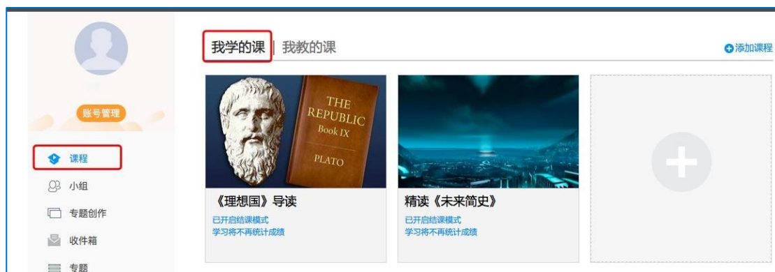
图 5 点击进入课程

进入课程后，可查看章节列表的知识点，右上角为学习导航，可即时收到老师发布的学习任务、测验、作业及考试，查看自己的学习进度，并进行资料中的拓展学习，也可参与讨论、提问等。