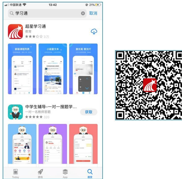
图 1 下载“学习通”