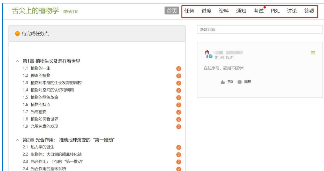
图 6 进行课程学习

进入课程后，可查看章节列表的知识点，右上角为学习导航，可即时收到老师发布的学习任务、测验、作业及考试，查看自己的学习进度，并进行资料中的拓展学习，也可参与讨论、提问等。