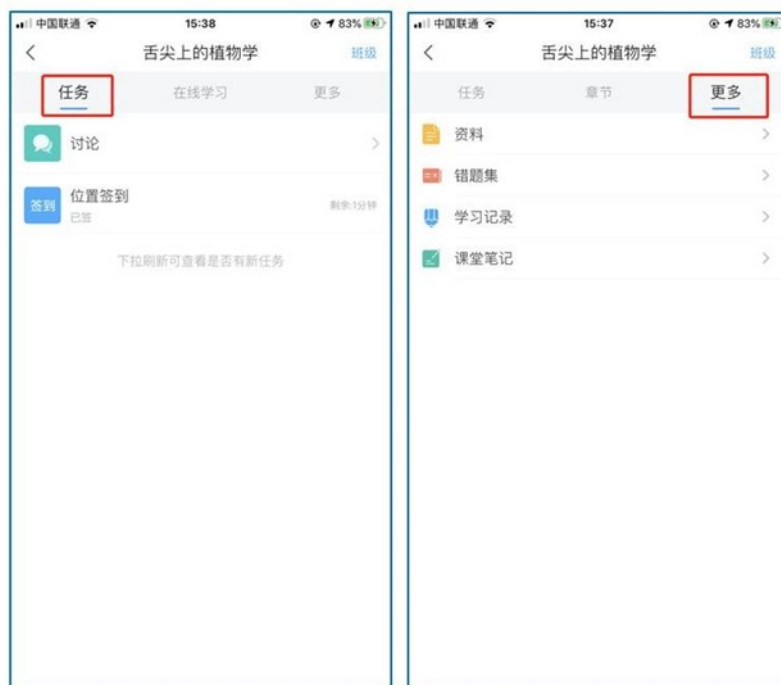
图 8 移动端课程任务及更多

此外，点击“任务”，可查看老师发放的学习任务及各类通知，点击“更多”可查看老师准备的学习资料和这门课程的个人错题集。