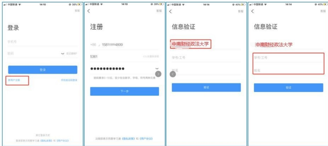
图 2 注册—信息验证流程